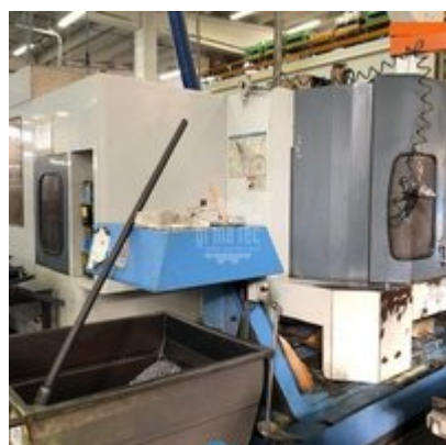
Tavola in contino 4 asse